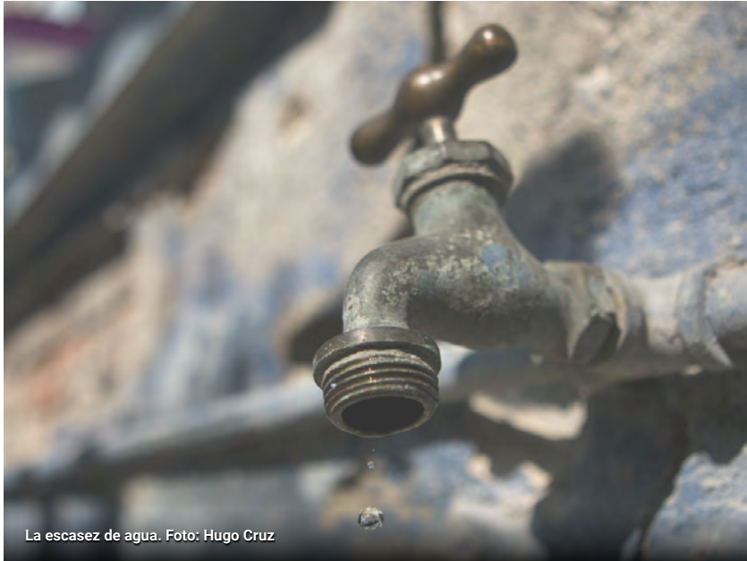
La escasez de agua.