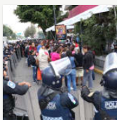
Ser policía en México, sinónimo de bajos salarios, abuso sexual y corrupción