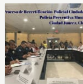
La policía en ruinas