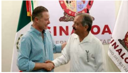
Recibirá Estrada Ferreiro una alcaldía en quiebra

( https://riodoce.mx/noticias/recibir-estrada-ferreiro-una-alcaldia-en-quiebra )