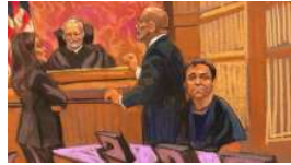
El 'Chapo' Guzmán con todo en contra; su mamá pide juicio justo

( https://riodoce.mx/noticias/recibir-estrada-ferreiro-una-alcaldia-en-quiebra )