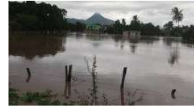
El recuento de daños de 'Willá' que no termina

( https://riodoce.mx/noticias/el-desastroso-efecto-de-willa-en-el-rosario )