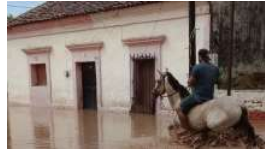
El desastroso efecto de 'Willá' en El Rosario

( https://riodoce.mx/noticias/el-chapo-guzman-con-todo-en-contra-su-mama-pide-juicio-justo )