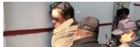
Frustran asalto frente a la casa de transición de AMLO (Video)

de BuzzFeed, en los estrenos de Netflix para agosto