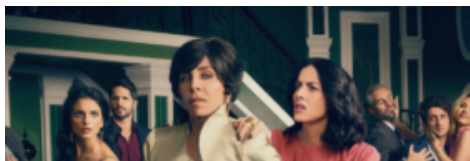
El regreso de Verónica Castro y cómo es el trabajo de los reporteros