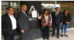
POLÍTICA Si hay fraude, se van a encontrar con el diablo: Yeidckol Polevnsky