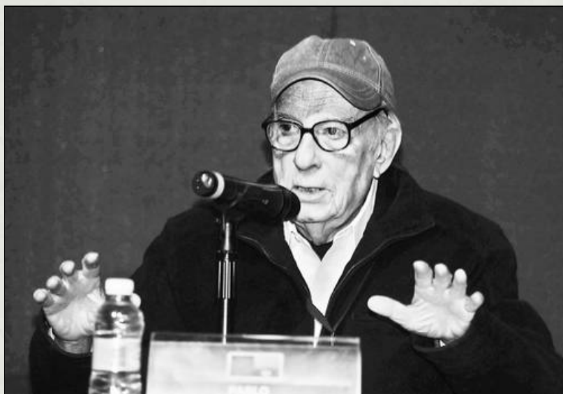
Los trabajadores, ante las avalanchas reformistas, no sólo deben organizarse para "discutir salario o ropa de trabajo", sino política y economía, dijo el ex rector de la UNAM Pablo González Casanova. Imagen de archivo • Foto Carlos Cisneros