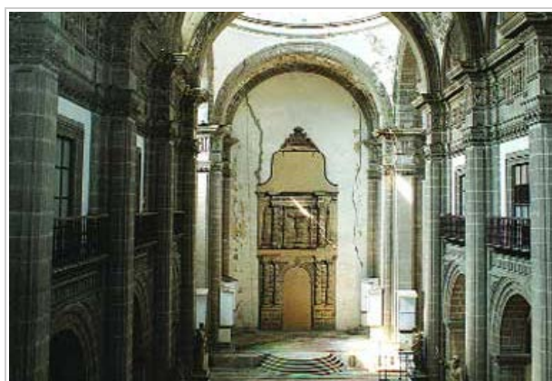
INTERIOR. DONDE SE MUESTRA EL DETERIORO DEL EX CONVENTO DE SAN AGUSTÍN.

2012-09-17 | Hora de creación: 21:28:38 | Última modificación: 21:28:38