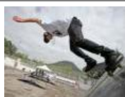
Dan tarjetas de descuento con restricciones a jóvenes