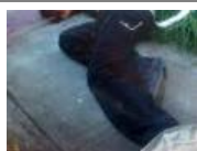
Cadáver carcomido por perros es hallado en Toluca