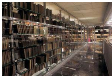
DETALLES DEL ACERVO Resguarda, entre otros fondos, la información generada de 1821 a 1995 sobre las relaciones internacionales y la política exterior de México.

Gran parte de los archivos históricos de las dependencias federales se encuentran en precarias condiciones de conservación. Los miles de documentos que contienen la memoria del país permanecen guardados en bodegas, sin un orden específico y, muchas veces, sin que ese acervo se haya actualizado desde hace décadas.