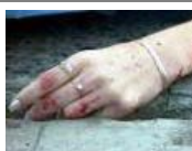
Acuchilla y mata a su pareja tras discusión