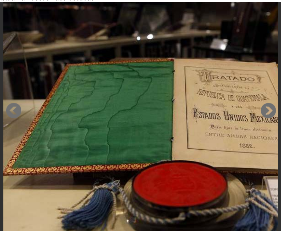
Archivos históricos de las dependencias federales se encuentran en precarias condiciones de conservación

Buena parte de los acervos sobre la memoria del país no están bien conservados ni se actualizan desde hace décadas