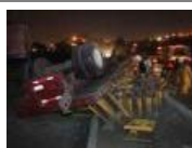
Muere tras volcar tráiler en la México-Querétaro