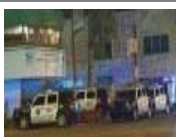
Pedirán presencia del Ejército en Nezahualcóyotl