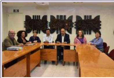
Click para ver fotos

Los científicos de la Universidad Veracruzana (UV) que conforman la representación del sector académico al interior del Consejo Estatal Forestal coincidieron junto a sus pares de otras instituciones en el rechazo al cambio de uso de suelo para el proyecto de minería en La Paila, municipio de Alto Lucero, en Veracruz.