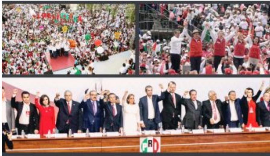
( http://www.sinembargo.mx/?p=3354442 )

Inseguridad y corrupción serán una loza de plomo para el PRI en 2018, dicen analistas políticos ( http://www.sinembargo.mx/?p=3354442 )