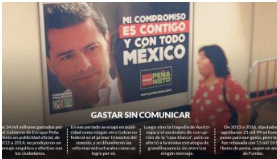
( http://www.sinembargo.mx/?p=3348497 )

En un sexenio con ríos de dinero para prensa, el Gobierno no pudo ni comunicar, dicen especialistas ( http://www.sinembargo.mx/?p=3348497 )