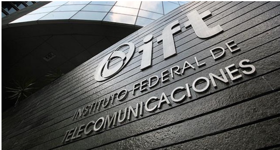
El Instituto Federal de Telecomunicaciones (IFT) no debe quedarse con los brazos cruzados. Fue prácticamente “asaltado” en sus atribuciones por los legisladores que desdibujaron en la Ley Federal de Telecomunicaciones y Radiodifusión los derechos de las audiencias en la reforma publicada el 31 de octubre. Defender su autonomía constitucional es para evitar, justo, lo que sucedió: la imposición de intereses particulares y la nulificación de los contrapesos en un Estado democrático.