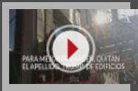
Quitan el apellido de Trump de edificios de NY (Video)