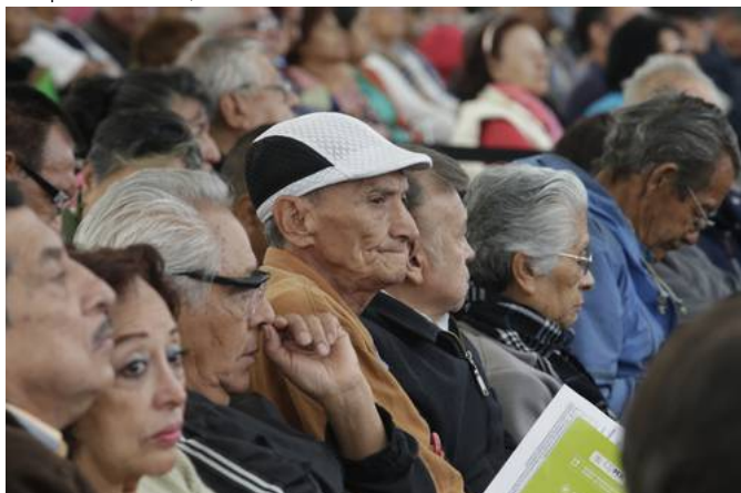
El envejecimiento "es un proceso que empieza desde que nacemos, y deberíamos reconceptualizarlo", señalaron especialistas.

Emir Olivares Alonso | miércoles, 23 nov 2016 07:41