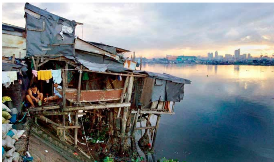
Desigualdad, uno de los temas.

"Estaremos pendientes de los resultados de este nuevo espacio universitario que contribuirá, sin duda, al debate, discusión y propuestas para enfrentar problemas nacionales", remarcó.