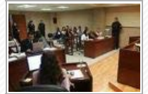
Educación para la operación de los Juicios Orales