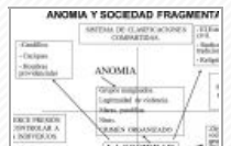
México: una sociedad anómica que se fragmenta