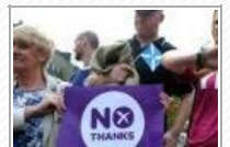
El Reino Unido, España y México