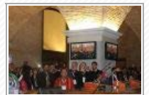
Tierra, techo y trabajo. 1ª parte.