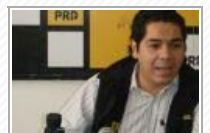
Con este PRD, ¡hasta aquí!