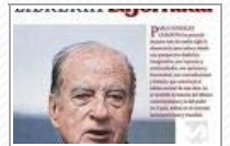
Un acercamiento al inspirador pensamiento de Pablo González Casanova