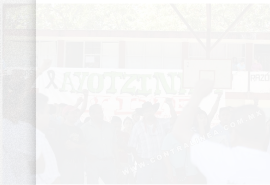
"México está buscando las condiciones propicias para que se pueda dar un estallido social comparable a 1910 y a 1968"

Estrategia que inició con la caída del entonces gobernador Ángel Aguirre Rivero y la llegada del actual gobernador interino Rogelio Ortega Martínez. Una táctica previamente ensayada en Michoacán, tras la salida de Fausto Vallejo y el interinato de Salvador Jara Guerrero.