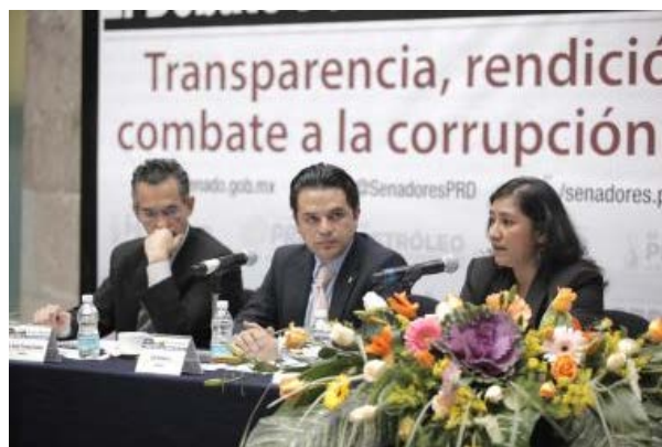
Senadores PRD :: BOLETIN DE PRENSA

“Los ingresos totales en 2012 ascendieron a un billón 647 mil millones de pesos; esos montos tan grandes tienen que ser manejados con la mayor transparencia, con los sistemas más avanzados de rendición de cuentas”, indicó.