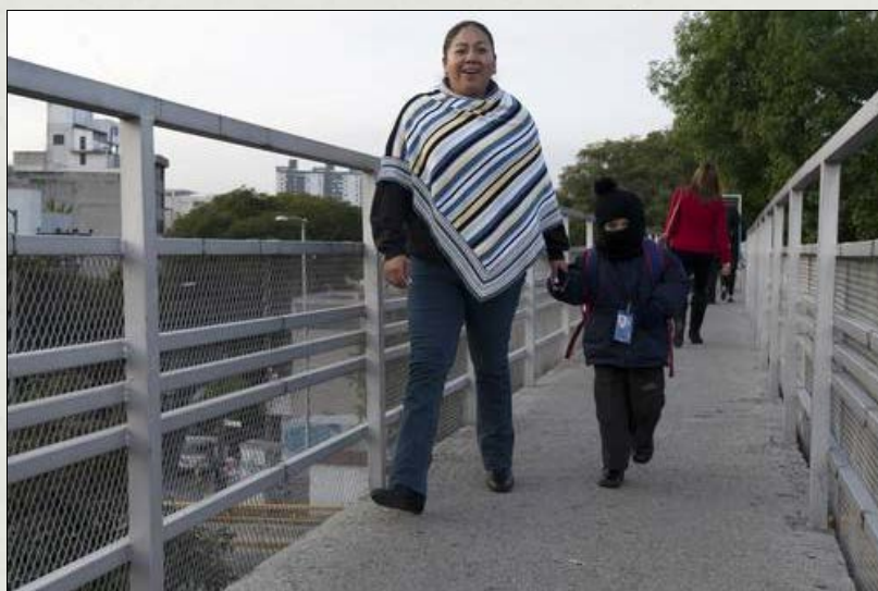
En México 30 millones de mujeres son madres, y de éstas 6 millones son jefas de familia

Con frecuencia se incumplen lineamientos de la OMS y les hacen cirugías sin su consentimiento, destaca