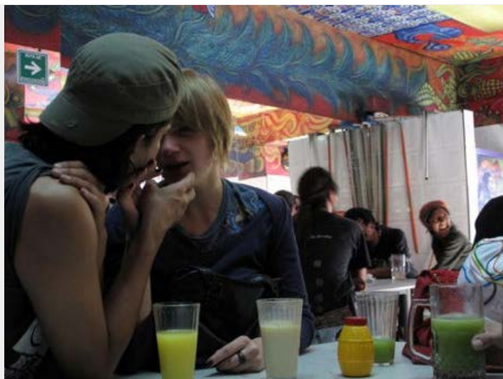
Una pulquería actual en el Centro Histórico de la ciudad de México.

culpó a las bebidas alcohólicas como el whisky o el vodka de ello. En el porfiriato el pulque se comenzó a industrializar y en las fábricas textiles hubo cierto ausentismo, y al igual que en Europa, culparon al pulque. Además, comenzaron a surgir ideas racistas en esos años. En este país nunca hubo