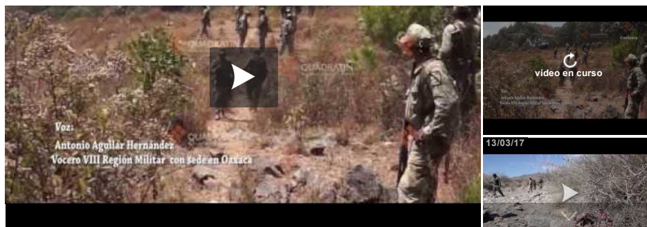
Video Smart Player invented by Digiteka