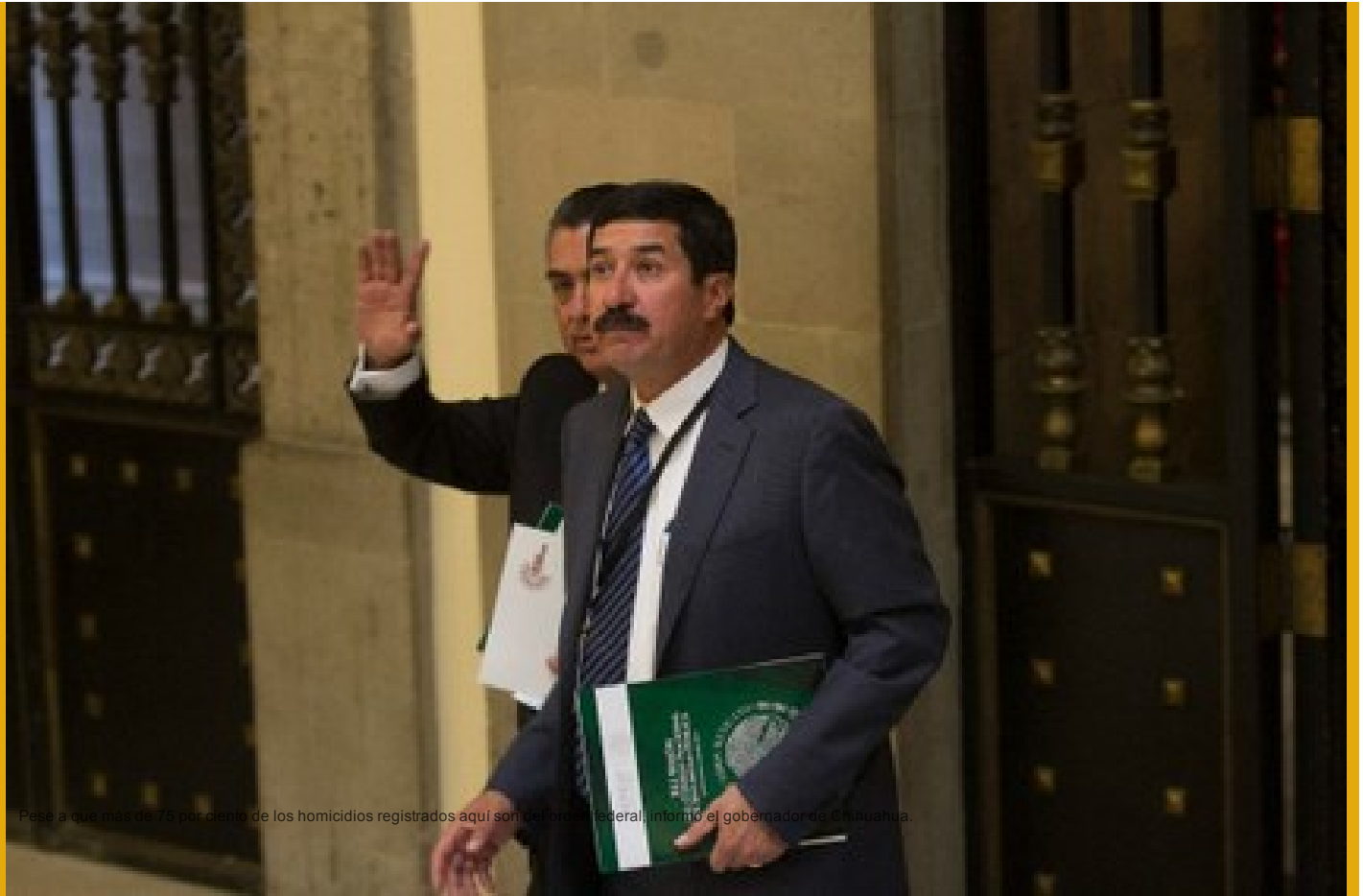
Pese a que más de 75 por ciento de los homicidios registrados aquí son de origen federal, informó el gobernador de Chihuahua.

Corral anuncia "avances importantes" en indagatoria de Breach ( http://www.jornada.unam.mx/ultimas/2017/03/27/corral-anuncia-avances-importantes-en-indagatoria-de-breach )