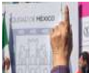
El lunes INE dará