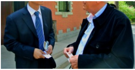
Encuentro con Investigadores chinos en Beijing.

logo me interesan más las diferencias y me he fijado más en las diferencias. Me parece que son universos culturales muy diferentes.