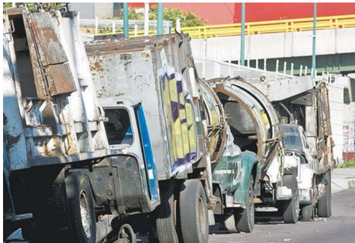
Filas de vehículos recolectores afuera de las plantas. (Mónica González)

REPORTAJE POR FRANCISCO MEJÍA Y ALEJANDRO MADRIGAL 10/06/2014 02:39 AM