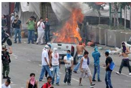
PESQUISA. La dependencia analiza acusar de sabotaje a los 23 detenidos en los desmanes.

El procurador Jesús Rodríguez Almeida informó que