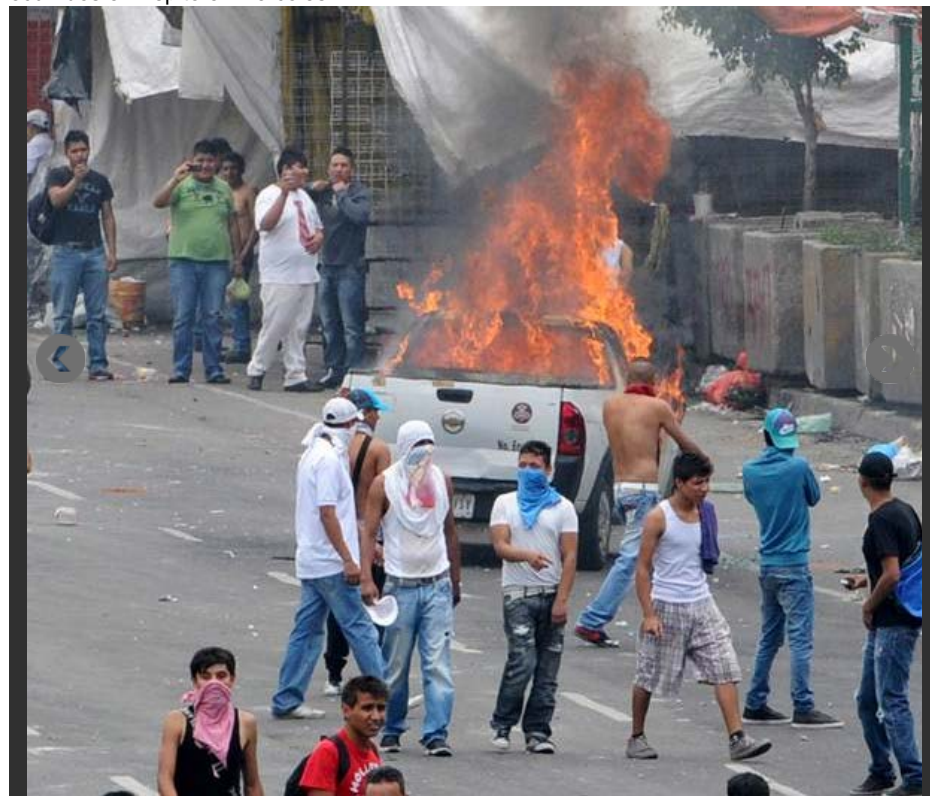
La SSPDF realizó un operativo en Tepito cuya misión era recuperar aparatos electrónicos robados en Ecatepec, estado de México Michel Narvaez

La Procuraduría General de Justicia del Distrito Federal dio a conocer que trabaja para ubicar a dos individuos captados pistola en mano disparando a los policías en los disturbios ocurridos en Tepito el miércoles