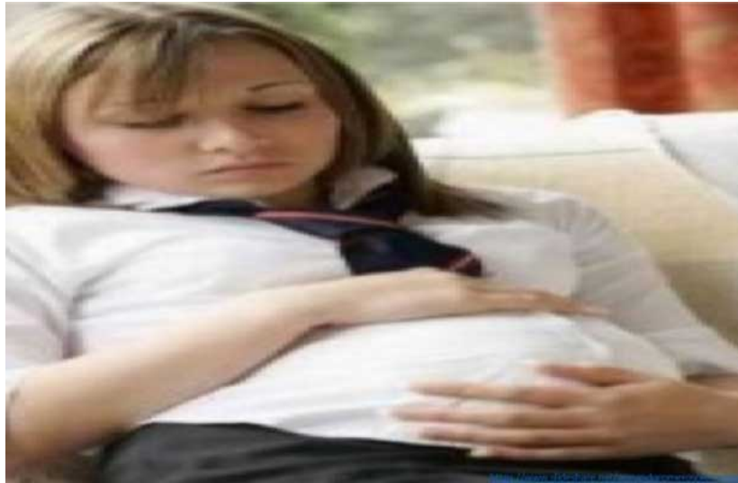
Los embarazos en adolescentes van en aumento y el riesgo de muerte es alto en ellas. https://www.diariodexalapa.com.mx/veracruz/consecuencias-del-embarazo-en-adolescentes