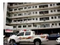
Global Asesinan a hermanos en hospital, uno de ellos estaba en cirugía