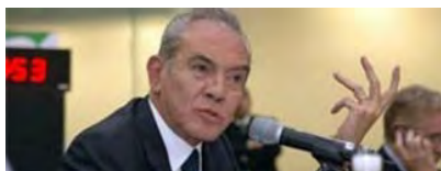
Muere Arnaldo Córdova, politólogo e historiador

PORTADA NACIONAL GLOBAL DINERO COMUNIDAD ADRENALINA FUNCIÓN HACKER EXPRESIONES OPINIÓN SUPLEMENTOS MULTIMEDIA