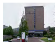
Rotterdam tras recibir ducha con agua hirviendo

Era considerado especialista en el estudio de la filosofía de Immanuel Kant, Friedrich Hegel, Karl Marx, Nicolás Maquiavelo y otros clásicos precursores de la teoría política.