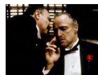
Funcion 'El Padrino' se mantiene como la película favorita