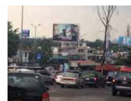
Comunidad Protestan capitalinos por modificación al 'Hoy no Circula'