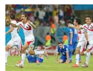
Adrenalina En penales, Costa Rica consigue histórico pase a cuartos ante Grecia