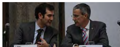
Blinda de injerencias el INE elección de consejeros OPLEs: Córdova