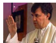
Nacional Analiza el Vaticano expulsión de cura pederasta en SLP