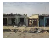
Global Al menos 15 muertos en nuevo ataque terrorista en Nigeria