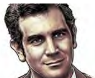
Retrato hablado: Las rutas de Lorenzo Córdova, consejero presidente del INE