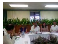
Nacional Aspiran más de 193 mil a 14 mil 415 plazas de docentes