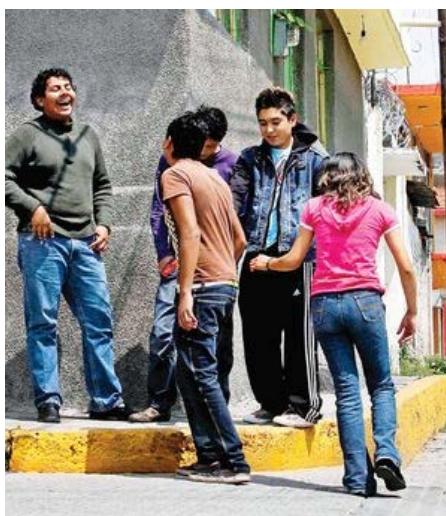
ANÁLISIS. Para los jóvenes, la escuela ya no es un mecanismo de ascenso social, dice experto.

Hace años, en el DF, hizo un diagnóstico que se llamó Juventud popular y bandas, del que surgió el proyecto llamado Circo Volador. El modelo busca articular esfuerzos de agrupaciones civiles que trabajan en las localidades, colectivos y la comunidad en general para lograr su objetivo.