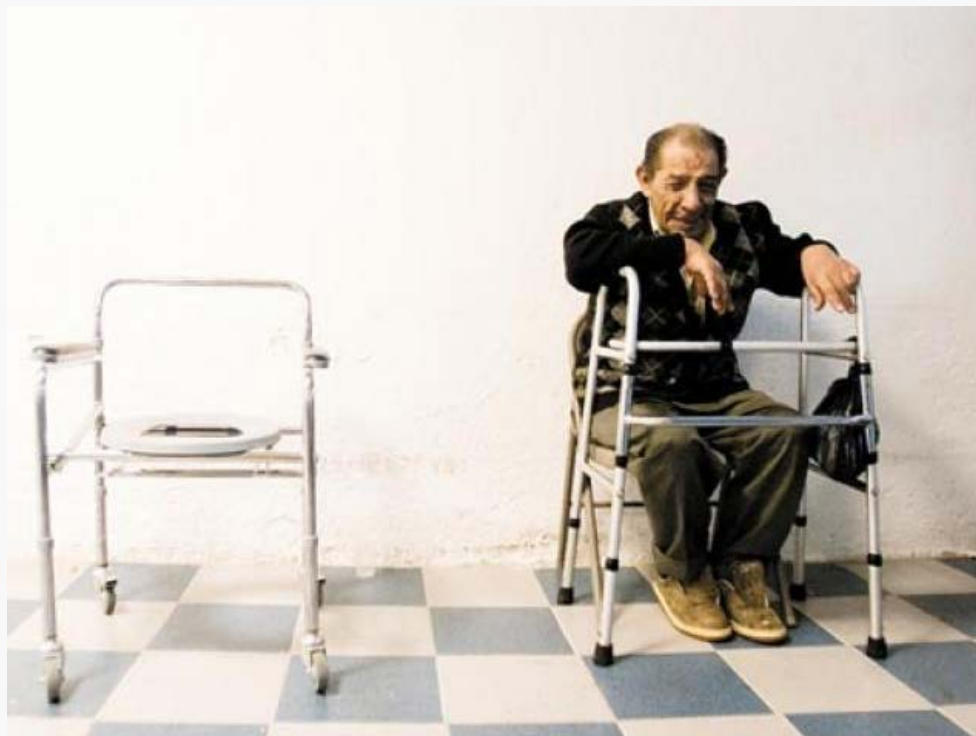
Un 20 por ciento de los ancianos que ingresan al país son abandonados en albergues o la vía pública.

Ante esa situación de abandono que se ha acrecentado en la mayoría de los condados de California, Pebley indicó que se ha reforzado la vigilancia en parques, iglesias y centros comerciales, lo que no ha impedido que de 20 sexagenarios abandonados al mes, la cifra se haya triplicado en los últimos dos años, particularmente en San Diego y el Valle Imperial.