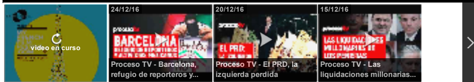
Video Smart Player invented by Digiteka