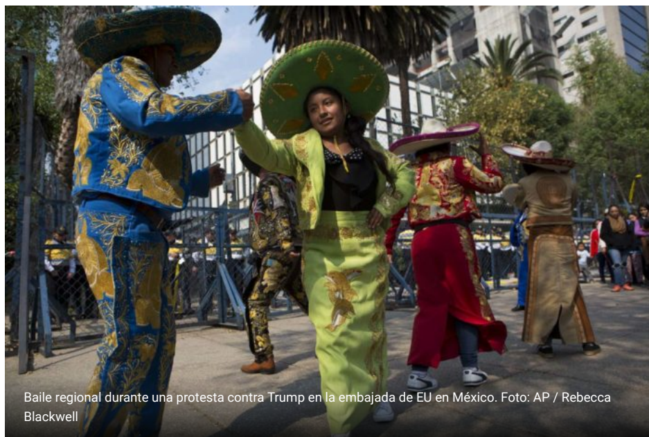
Baile regional durante una protesta contra Trump en la embajada de EU en México.