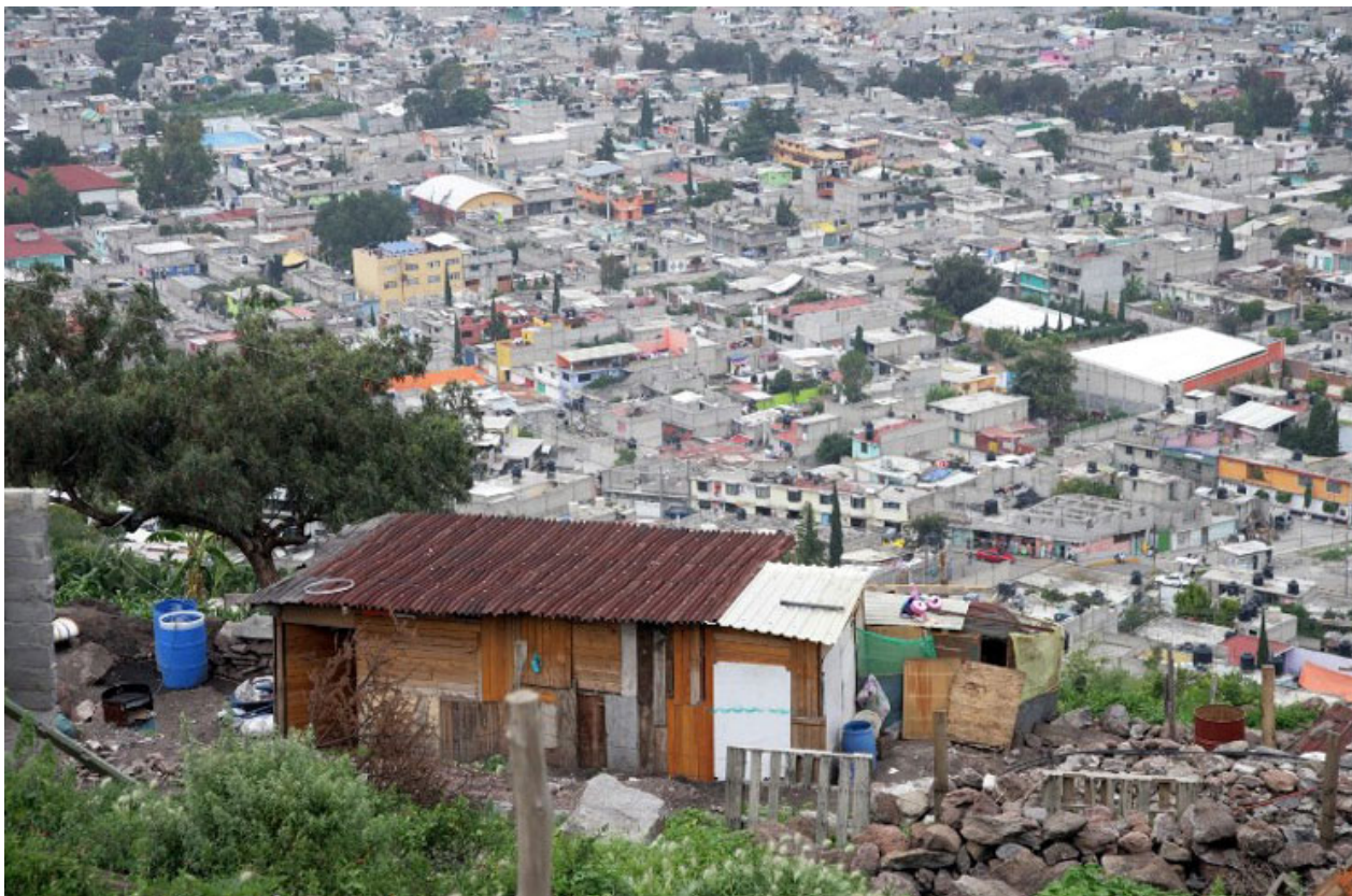
San Cristóbal de las Casas, Chiapas (arriba) y Ecatepec, Estado de México; dos lugares en su agenda.