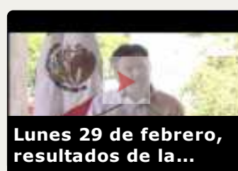
Lunes 29 de febrero, resultados de la...