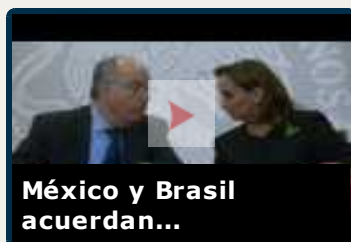
México y Brasil acuerdan...