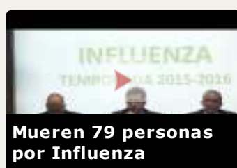
Mueren 79 personas por Influenza