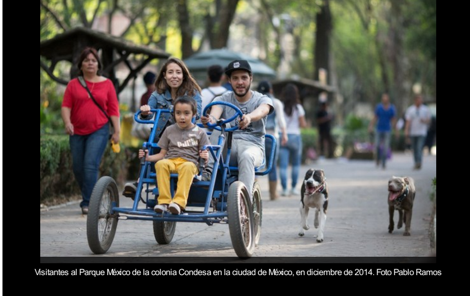
Visitantes al Parque México de la colonia Condesa en la ciudad de México, en diciembre de 2014.

México, DF. Este mediodía fueron presentados los resultados de la Encuesta Nacional de Satisfacción Subjetiva con la Vida y la Sociedad, elaborada por académicos de la Universidad Nacional Autónoma de México (UNAM). Los datos arrojaron que 82 por ciento de los mexicanos se dijo satisfecho o muy satisfecho con la vida, mientras que 18 por ciento de la población se declaró abiertamente insatisfecha.