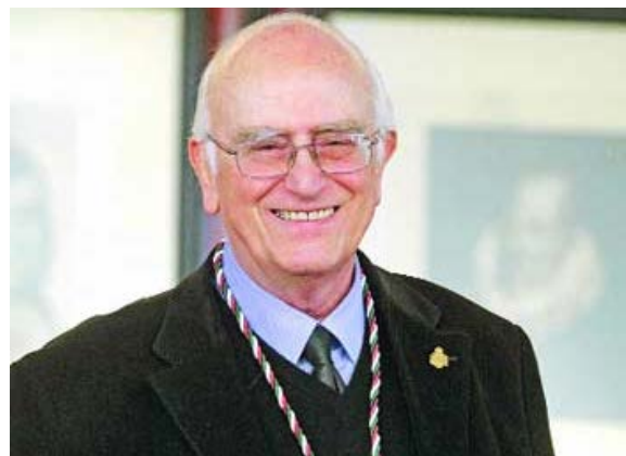
Énfasis. Roger Bartra, Premio Nacional de Ciencias y Artes, criticó el nacionalismo: traducción de la ironía.

Reyna Paz Avendaño | Cultura | Fecha: 2014-02-14 | Hora de creación: 22:18:20 | Última modificación: 22:18:20