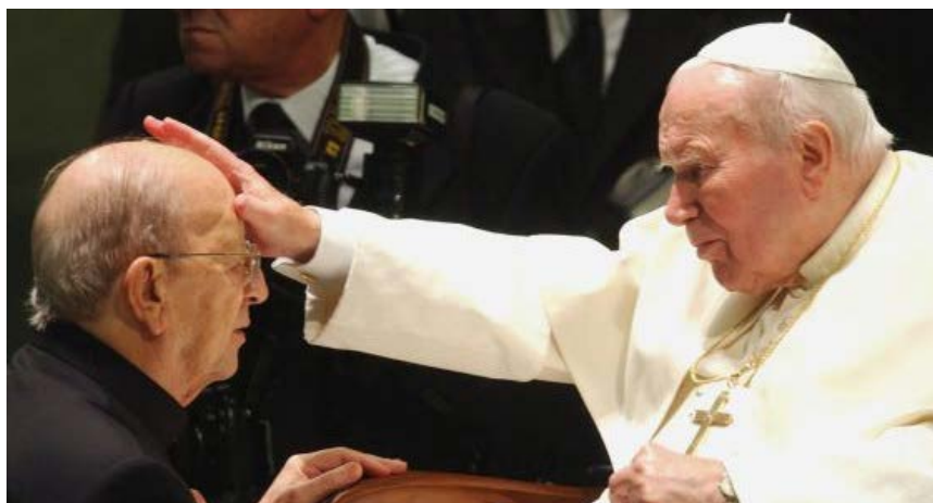
Juan Pablo II, junto a Marcial Maciel

Archivado en: Marcial Maciel Benedicto XVI Renuncia papal Pederastía Sucesión Papa México Papa Latinoamérica Delitos sexuales Clero Iglesia católica Delitos Cristianismo América