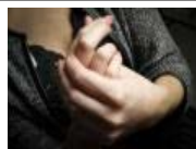
'Mi sacrificio era prostituirme'