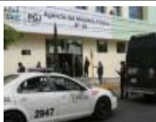
Delegaciones que más 'se quejan' de los MP