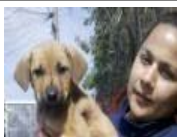
Cárcel y multa para quien maltrate animales