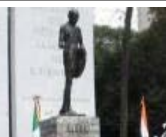
Monumento a Gandhi será foro de la 'no violencia'