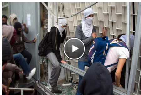
Video Activistas causan destrozos en CU; toman oficinas de CCH.

Ciudad de México | Viernes 15 de febrero de 2013 Natalia Gómez | El Universal 20:18