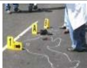
Mata a joven por resistirse a asalto; paga 7 años después