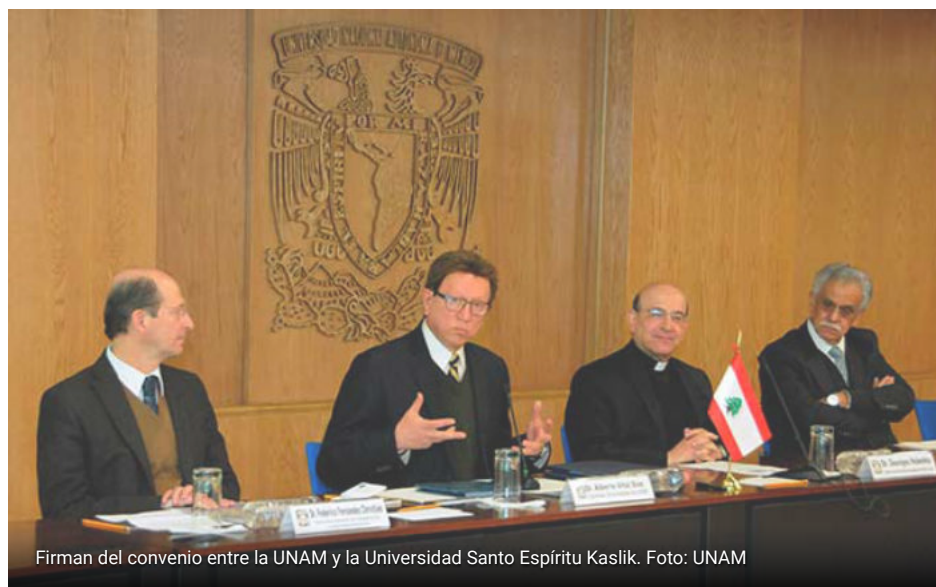
Firman del convenio entre la UNAM y la Universidad Santo Espiritu Kaslik.