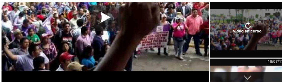
Video Smart Player invented by Digiteka