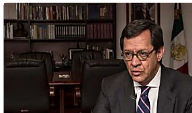
Gobierno de México 'listo' para dar una explicación sobre los 43 desaparecidos