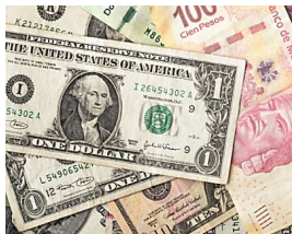
Cómo Invertir Sabiamente Pequeñas Cantidades A3 Trading