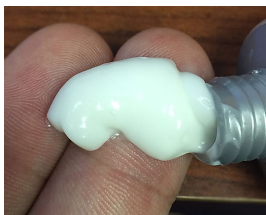
Hombres: Como verse joven después de los 50 años vanidades.co