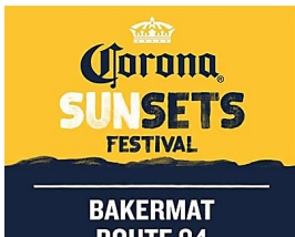
Así se vivió el Corona Sunsets Festival Acapulco 2016