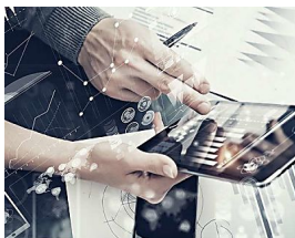
Tecnologías que simplifican la gestión de la tesorería