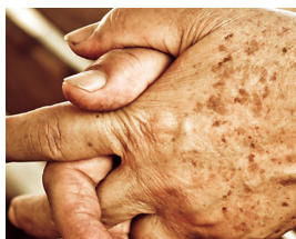
¿Cómo Eliminar Las Manchas En La Piel? Real Skinlabs