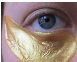
1 Consejo Para Eliminar Las Bolsas de Sus Ojos en Menos de 2 Minutos Portal de Salud