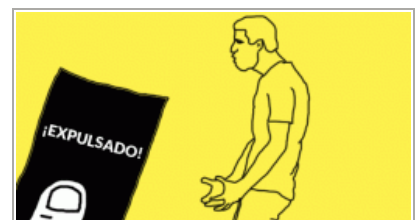
Twitter Maldito | 2 de mayo