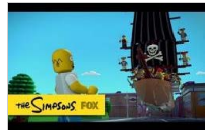
Los Simpson se convierten en figuras de Lego para celebrar su episodio número 550 (VIDEO)

Iniciar slideshow ( anterior siguiente )